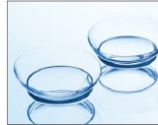
При правильном положении линзы она напоминает по форме «чашечку», ее края направлены вверх.

После надевания линз вы перестанете их ощущать через несколько секунд.